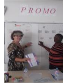
Etudiants en soins infirmiers de 2 ème année