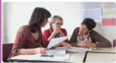
Formateurs et direction IFSI , Chercheur en science de l'éducation