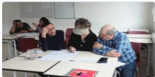
Patients intervenants et professionnels de terrain