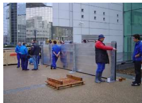
Exercice de montage de barrière anti-crue en 2005 à l'HEGP