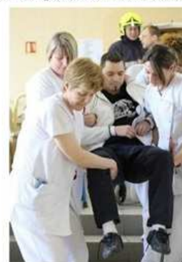
Exercice d'évacuation dans un EHPAD (Saône et Loire)