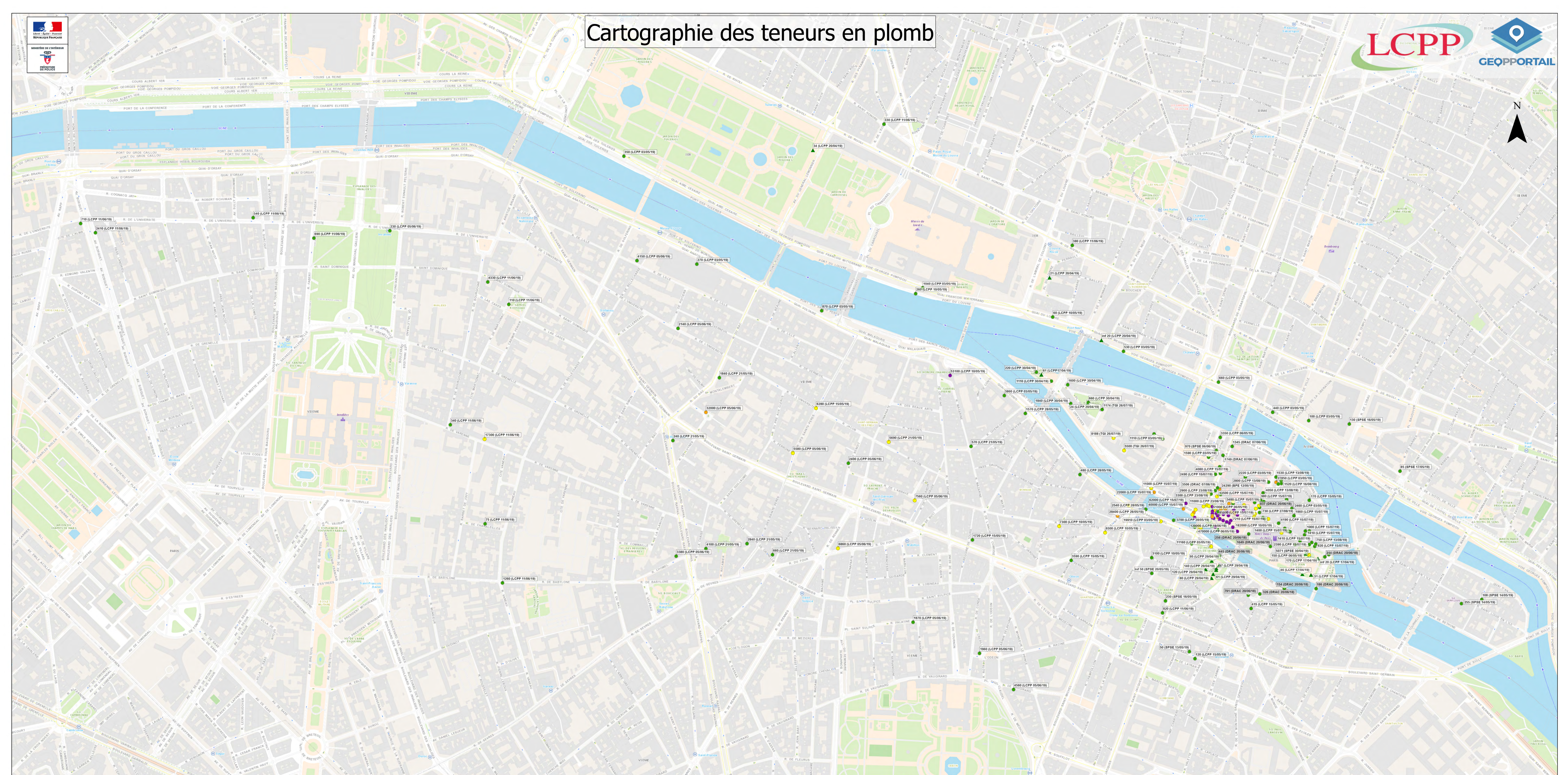
Zoom sur l'île de la cité