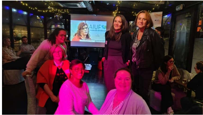
Une partie de l'équipe de l'URPS lors de la soirée de clôture