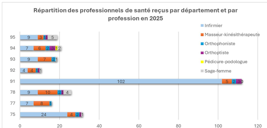
La place des orthoptistes dans l'accueil des professionnels de santé par département (2025)