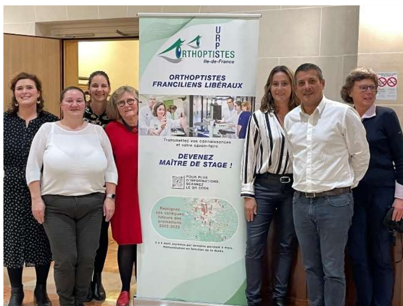
Les membres de l'URPS orthoptistes d'Île-de-France lors de la soirée du 9 octobre

Le 9 octobre 2025, l'URPS a tenu la quatrième soirée annuelle du programme CPOM Tuteur, événement marquant le succès d'une initiative clé pour dynamiser l'installation libérale en Île-de-France, avec la participation de l'ARS, des tuteurs, des représentants des étudiants, des présidents d'URPS franciliennes mais également cette année par des présidents d'URPS Orthoptistes IDF, des représentants des différents pays européens et de la présidente du SNAO.